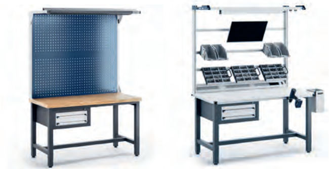
Bestehende Arbeitsplätze können mit dem modularen CLIP-O-FLEX® Arbeitsplatzsystem einfach auf- oder umgerüstet werden.

Mit CLIP-O-FLEX® Workplace werden auch bestehende Arbeitsplätze optimiert. Diesen Vorteil nutzte ein Kunde um statische in flexible Arbeitsplätze umzurüsten zum Beispiel auf diese Weise: Bewährte Arbeitstische wurden vom gewohnten, starren Lochbrett auf das flexible CLIP-O-FLEX® Halterungsmodul umgerüstet. Anstelle einer fixierten Tischkante wurde auf CLIP-O-FLEX® Zubehör- und Komponenten umgerüstet. Diese einfach einsetz- und befestigbaren Tablare ermöglichen eine schnelle Anpassung auf individuelle Bedürfnisse verschiedener Anwender:innen.