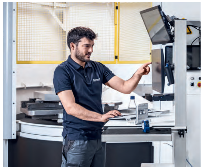
Wohlbefinden und Produktivität durch ergonomische CLIP-O-FLEX® Systemarbeitsplätze