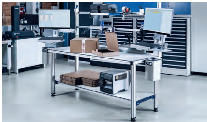
Aus einem Arbeitstisch werden zwei: Platzeinsparung mit zusätzlichen Vorteilen im Kommissionierungsprozess

Kommissionierungsprozess mit sich bringen. Die komplette Tischfläche ist für das Kommissionieren der Ware verfügbar, da die benötigten Arbeitsmittel per CLIP-O-FLEX® Zubehör im hinteren Bereich sehr flexibel angebracht und einsetzbar sind. Dank der eingebauten Energieleiste können die PCs und Bildschirme, sowie der für die Versandpapiere eingesetzte Drucker sehr einfach angeschlossen werden, die Kabel sind dazu noch nahezu unsichtbar verstaubar.