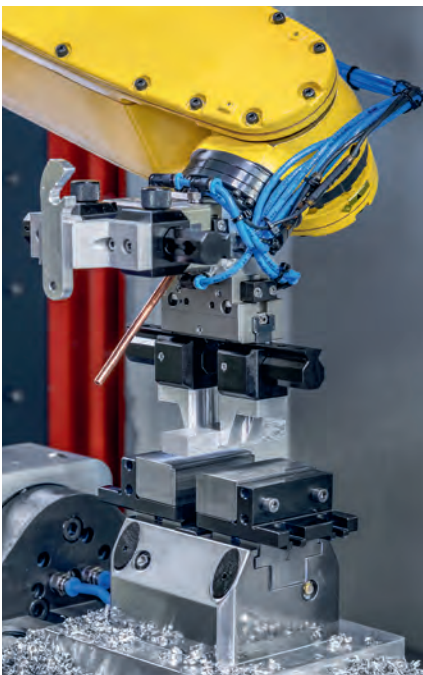
Moderne Roboter und Software kooperieren perfekt mit dem Delphin Spannsystem. So kann Ihre Maschine rund um die Uhr arbeiten.

Die METZLER Fertigungsprofis stehen bereit, um Fertigungsunternehmen auf dem Weg zu mehr Automatisierung verlässlich, kompetent und partnerschaftlich zu begleiten. Gemeinsame Zielsetzung ist es dabei stets, Prozesse zu optimieren und damit Effizienz, Qualität und Wirtschaftlichkeit zu steigern. Kunden profitieren dabei nicht nur von einer breiten Auswahl an leistungsfähigen und flexibel einsetzbaren Technologien. Die Spezialisten von METZLER wissen zudem um die jeweils beste Automationslösungen für den individuellen Bedarf und können sogar bei der Implementierung mit Know how und maßgeschneiderten Systemkomponenten unterstützen.