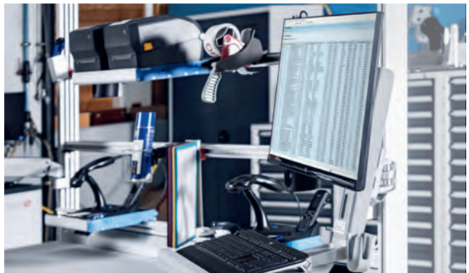
CLIP-O-FLEX® Arbeitsplatzsysteme garantieren mehr Ordnung, Übersicht und Sauberkeit am Arbeitsplatz.

Der CLIP-O-FLEX® Systemwagen ermöglicht die unmittelbare Bereitstellung von Arbeitsmaterial dort, wo es verarbeitet und gebraucht wird. Das reduziert Laufwege sowie den Platzverbrauch in der gesamten Fertigung.