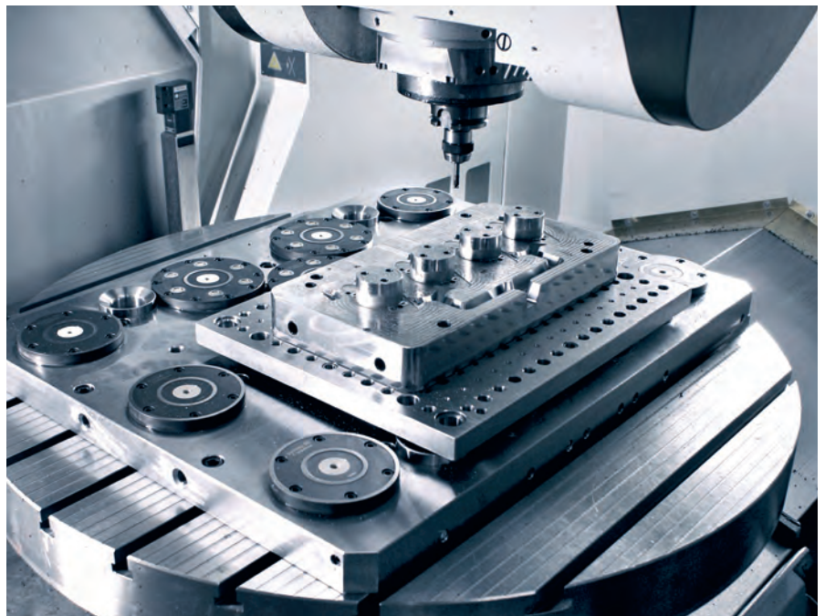
Roboterautomatisierung mit flexiblen und modularen Roboterzellen – für den Einstieg in die Automatisierung bis hin zur Hightech-Lösung.

Der Einsatz von Robotik bildet in der spanabhebenden Fertigung nach wie vor den Kernbereich von Automatisierung ab. Diese Technologie wird oft mit den in einigen Fertigungsstätten etablierten „Roboterarmen“ in Verbindung gebracht. Dabei wird übersehen, dass die Anwendung von Robotik in der Fertigung inzwischen sehr vielseitig sein kann. So verfügen die METZLER Fertigungsprofis über Wissen und Know how in Bezug auf ein breites Portfolio an Automatisierungslösungen, welche die Fertigung sicherer, effizienter und wirtschaftlicher machen.