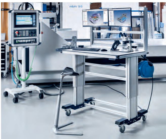
CLIP-O-FLEX® Systemarbeitsplätze wandeln fix verankerte und starre Systeme zu mobil einsetzbaren und höhenverstellbaren Arbeitsplätzen.

Einige Kunden erkannten nach eingehender Beratung den Wert der Ergonomie am Arbeitsplatz. Die elektrisch höhenverstellbaren CLIP-O-FLEX® Systemarbeitsplätze tragen wesentlich dazu bei, dass das Wohlbefinden der Anwender und damit auch die Produktivität verbessert werden. Von der Einsparung an Platzbedarf profitierten wiederum andere mit den Lösungen von CLIP-O-FLEX® Workplace: Aus einem Arbeitstisch wurden zwei Kommissionierarbeitsplätze geschaffen, die keinen Nachteil für die Anwender sondern noch zusätzlichen Vorteile im