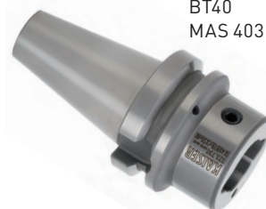
BT40 MAS 403