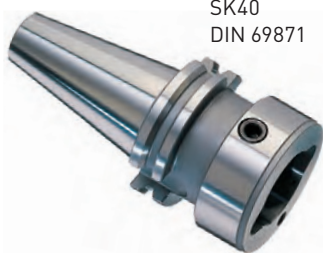
SK40 DIN 69871