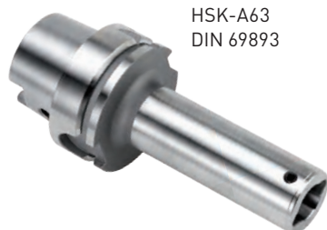
HSK-A63 DIN 69893